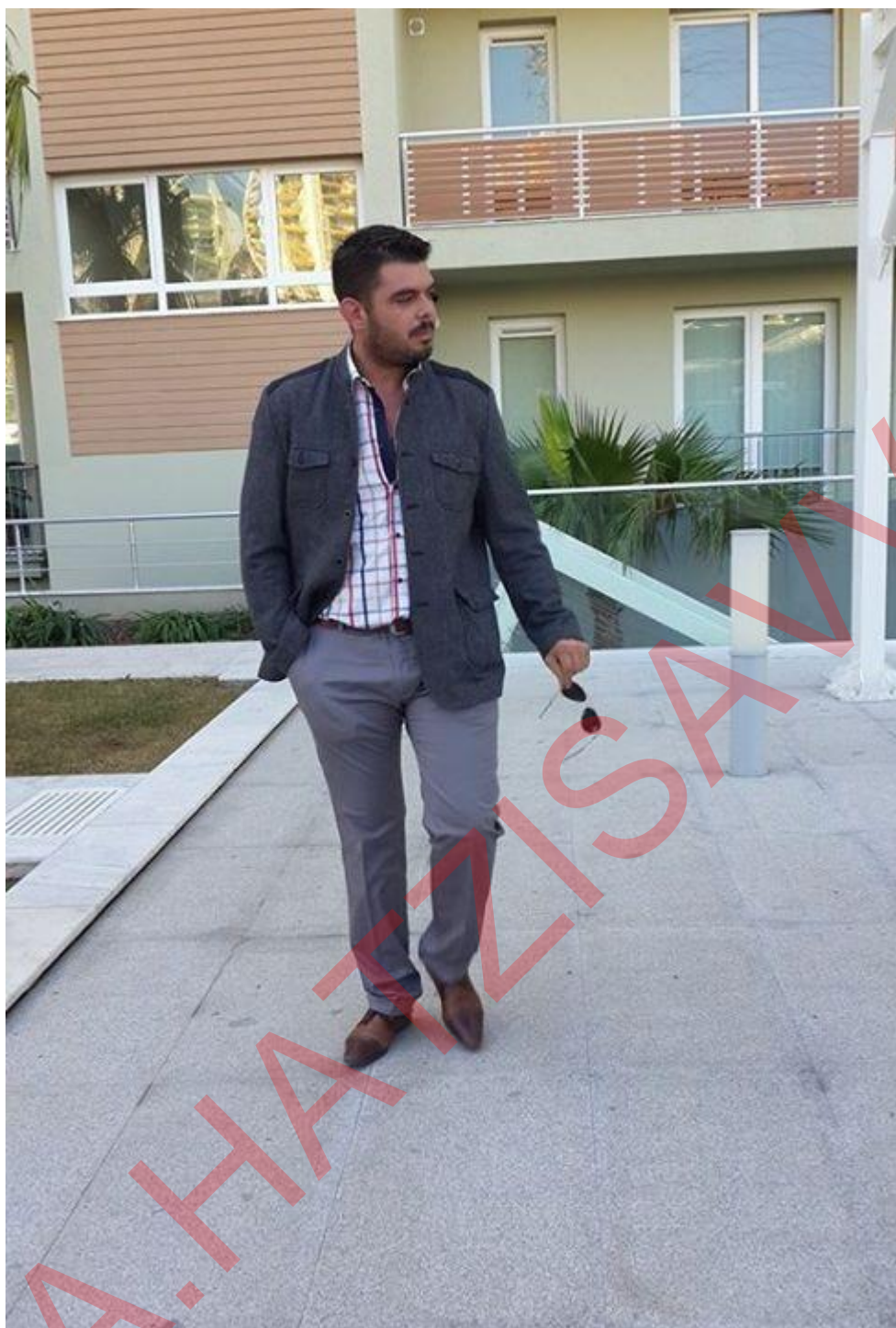
γασίν, έχει μαγαζί στο Bodrum, πηγαίνει συχνά Κω